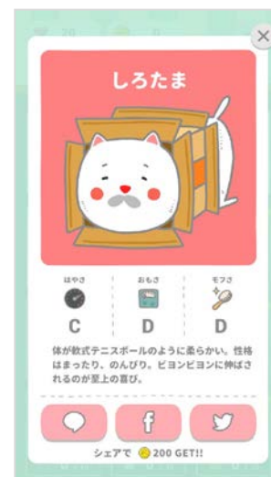
キャラクタープロフィール