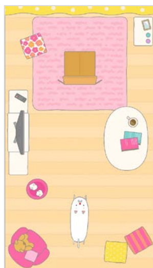
プレイ時（ひっぱり中）