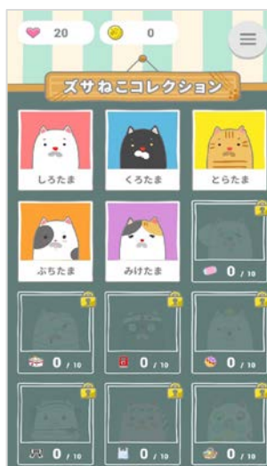
ズサねこコレクション